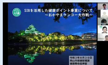
当日の講演の様子