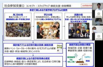
当日の講演の様子