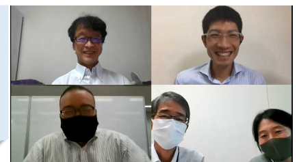
当日の講演の様子