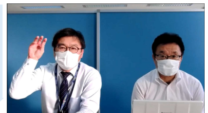
当日の講演の様子