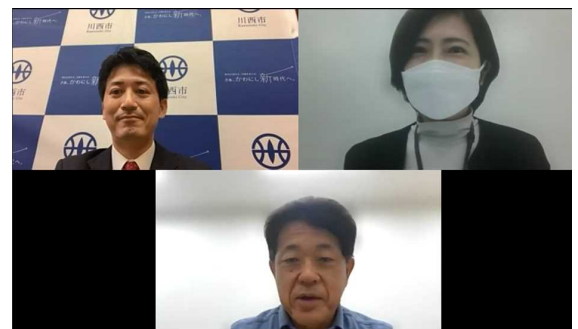
当日の講演の様子