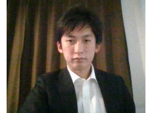
神奈川県 政策局 いのち・未来戦略本部室 SDGs推進グループ 下川様