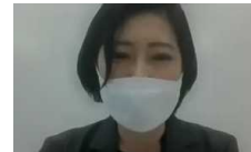
当日の講演の様子